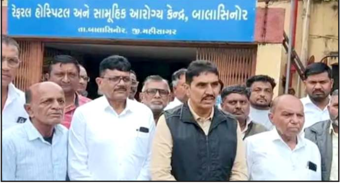
કેસલ હોસ્પિટલ અને સામૂહિક આરોગ્ય કેન્દ્ર, બાલાસિનોર ના આગેવાનો. જી. મહીસાગર

પ્રતિનિધિ, ગાંધીનગર મહિસાગર જિલ્લાના બાલાસિનોરમાં પોલીસ દ્વારા એક વિદ્યાર્થીને ઢોર માર મારવામાં આવ્યો હોવાની ઘટનાએ હવે મોટું રાજકીય સ્વરૂપ ધારણ કર્યું છે. આ કેસમાં પોલીસની કામગીરી અને રાજકીય આગેવાનોની દખલગીરીને લઈને વિવાદ વધ્યો છે. સુત્રોના કહેવા પ્રમાણે બાલાસિનોર તાલુકા પોલીસ સ્ટેશનના પીઆઈ પર એક વિદ્યાર્થીને નિદેશનાથી માર મારવાનો ગંભીર આરોપ લાગ્યો છે. એક મંદિરમાં થયેલી ચોરીના કેસમાં માત્ર શંકાના આધારે પોલીસ દ્વારા વિદ્યાર્થીને પુછપરછ માટે બોલાવવામાં આવ્યો હતો. પરિવારજનોના કહેવા પ્રમાણે