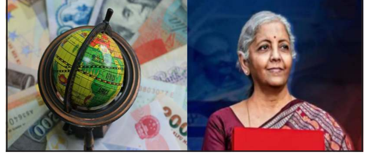
મોટો નથી. વિશ્વની ૨૭મી સૌથી મોટી અર્થવ્યવસ્થા સિંગાપોરનો કુલ જીડીપી બજેટ $574.185 બિલિયન છે, જ્યારે દેશનું બજેટ $583 બિલિયનથી વધુ છે.

જેમાંથી કેન્દ્ર સરકારની ચોખ્ખી કર આવક રૂ.૨૬.૭ લાખ કરોડ છે. કુલ ખર્ચ માટે સુધારેલ અંદાજ રૂ.૪૮.૬ લાખ કરોડ છે, જેમાંથી મૂડી ખર્ચ આશરે રૂ.૧૧ લાખ કરોડ છે. નોંધનીય છે કે, ૨૦૨૦ ના નાણાકીય વર્ષનું બજેટ ૧૬૫ દેશોના જીડીપી કરતા વધારે છે. ભારતની ૨૬મી સૌથી મોટી અર્થવ્યવસ્થા પછી, અન્ય કોઈ દેશનો જીડીપી ભારતના વાર્ષિક બજેટ જેટલો