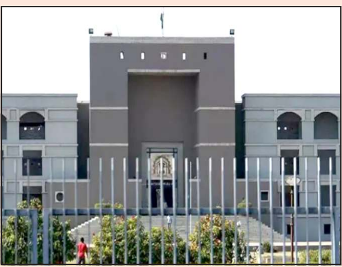
ઉલ્લેખનીય છે કે ૨૭ જાન્યુઆરીએ રહેવાસીઓને ઘર ખાલી કરવા નોટીસ આપી હતી. આ નોટીસો લઈ રહેવાસીઓ ભાજપના ધારાસભ્ય

પ્રતિનિધિ, ગાંધીનગર રાજકોટ શહેરના જંગલેશ્વર વિસ્તારના ડીમોલિશનની નોટીસ મામલે હાઈકોર્ટે મહત્વનો આદેશ આપ્યો છે. ૩ મહિના સુધી જંગલેશ્વર વિસ્તારમાં ડીમોલિશન નહી થાય, હાઈકોર્ટે ગુજરાત રેવન્યુ ડીપ્યુનલને અપીલ પર નિર્ણય કરવા આદેશ આપ્યો છે. અરજદારોને રીહેબીલીટેશન માટે પણ કન્સીડર કરવા નિર્દેશ આપ્યો છે. અરજદારોએ ડીમોલિશનની નોટીસને હાઈકોર્ટે સાથે ગુજરાત રેવન્યુ ડીપ્યુનલમાં ચેલેન્જ પણ કરી છે. રાજકોટ શહેરના જંગલેશ્વર વિસ્તારમાં ડીમોલિશન પર હાઈકોર્ટે રોક લગાવી દીધી છે. અને