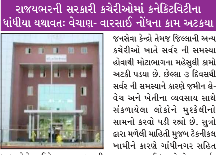
રાજ્યભરની સરકારી કચેરીઓમાં કનેક્ટિવિટીના ધાંધીયા યથાવત: વેચાણ- વારસાઈ નોંધના કામ અટક્યા

પ્રતિનિધિ, ગાંધીનગર રાજ્યમાં મહેસુલ વિભાગને લગતી મોટાભાગની કામગીરી ઓનલાઈન થઈ ગઈ છે. ત્યારે કલેક્ટર કચેરીઓમાં પણ ઓનલાઈન કામગીરી તેમજ વિવિધ નકલો મેળવવાની કામગીરી જનસેવા કેન્દ્રો તથા ઈ-ધરામાં થાય છે. પરંતુ છેલ્લા કેટલાક દિવસથી સર્વરમાં ખામીઓ સર્જાવાના કારણે જનસેવા કેન્દ્રોમાં આવતા અરજદારોને ધકકા ખાવાની નોખત આવી પડી છે. એટલું જ નહીં ઈ-ધરા કેન્દ્રોમાંથી ૭/૧૨ અને ૮-અ ના ઉતારાની નકલો પણ આપવાની બંધ છે. જેના કારણે ખેડુત ખાતેદારોને પણ મુશ્કેલીનો સામનો કરવો પડી રહ્યો છે. એટલું જ નહીં કામ માટે ધકકા ખાવાનો વારો આવ્યો છે. સર્વર ની ખામી ક્યારે દુર થશે તે પણ નક્કી નહી હોવાથી અરજદારોને મુશ્કેલીનો સામનો કરવો પડે છે. મહેસુલી