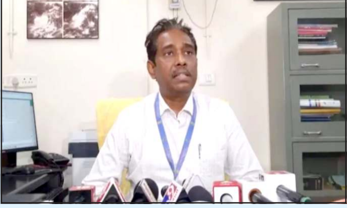
થઈ ગઈ છે. આ સાથે તેમણે આજે વરસાદની આગાહી કરતા જણાવ્યું હતું કે વડોદરા, ભરૂચ, અરવલ્લી, ખેડા, આણંદ, પંચમહાલ, દાહોદ અને મહિસાગર જિલ્લામાં ઇળવો વરસાદ થવાની શક્યતા છે. આ સાથે આજે અરવલ્લી, પંચમહાલ, દાહોદ અને મહિસાગર જિલ્લામાં તો યલો એલર્ટ આપી દેવામાં આવ્યું છે. આ ૪ જિલ્લાઓમાં વિજળી અને કડાકા

પ્રતિનિધિ, ગાંધીનગર ગુજરાતમાં છેલ્લા થોડા દિવસથી તાપમાનમાં વધઘટ જોવા મળી રહી છે. આજે બીજી ફેબ્રુઆરી ના રોજ સવાર થી ગુજરાતના કેટલાક વિસ્તારોના હવામાનમાં પલ્ટો આવ્યો છે. આ સાથે કેટલાક વિસ્તારોમાં વરસાદ પણ પડ્યો હતો. હવામાન વિભાગે આજની બીજી ફેબ્રુઆરી ની લેટેસ્ટ આગાહીમાં ગુજરાતના ૮ જિલ્લામાં વરસાદ પડવાની આગાહી આપી છે. તો બીજી તરફ તાપમાનમાં કોઈ મોટો ફેરફાર નહી થાય તેવું પણ જણાવવામાં આવ્યું છે. હવામાન વિભાગે અમદાવાદ કેન્દ્રના ડાયરેક્ટર એ કે દાસે આજે ગુજરાતના હવામાન અંગેની આગાહી આપી હતી. જેમાં તેમણે જણાવ્યું હતું કે ભેજ અને પવનની દિશાને કારણે ઠંડી ઓછી