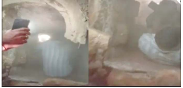
જ ચીસાચીસ કરી મુકી હતી. સદ નસીબે આજુબાજુના લોકો

પ્રતિનિધિ, ગાંધીનગર ગાંધીનગર મહાનગરપાલિકાની ગંભીર બેદરકારીના કારણે સેક્ટર ૧૨માં એક મોટી દુર્ઘટના સર્જાતા રહી ગઈ છે. સેક્ટર ૧૨ માં આવેલા વિશ્વકર્મા મંદિર નજીક રોડ પર ખુલ્લી રહેલી ગટરમાં એક ૩ વરસની માસુમ બાળકી અચાનક ખાબકી હતી. આ ગટર આશરે ૭ ફુટ જેટલી ઉંડી હોવાથી બાળકી અંદર પટકાતા