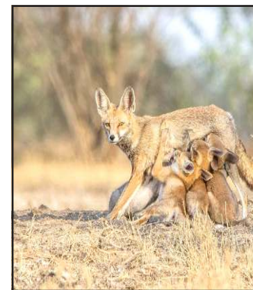
કુલ ૧૧૫ રાષ્ટ્રીય વેટલેન્ડ્સમાંથી ૮ રાષ્ટ્રીય વેટલેન્ડ્સ ગુજરાતમાં આવેલાં છે. ઉપરાંત, રાજ્યમાં ૧૯ વેટલેન્ડ્સ એવા છે જે મહત્વપૂર્ણ પક્ષી અને જૈવ વૈવિધ્યતા વિસ્તારો તરીકે ઓળખાય છે, જે પ્રવાસી તેમજ સ્થાનિક પક્ષીઓ માટે મહત્વપૂર્ણ આશ્રયસ્થાન પૂરું પાડે છે તેમ જણાવી મંત્રીશ્રીએ આ સિદ્ધિ બદલ આ મંત્રી ગુજરાતીઓને શુભેચ્છાઓ પાઠવી હતી.