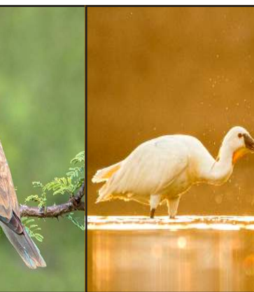
પક્ષીઓ અને વન્યજીવોનું સ્વર્ગ: છારી-ઢંઢ ખાતે પક્ષીઓની ૨૫૦થી વધુ પ્રજાતિઓ નોંધાયેલી છે. શિયાળા દરમિયાન અહીં સાઈબેરિયા, મધ્ય એશિયા અને યુરોપના ૨૫,૦૦૦ થી ૪૦,૦૦૦ જેટલા કોમન કેન (કુંજ), મળતાવડી ટીટોડી અને ચોટીલી પેણ સ્થળાંતર કરીને આવે છે. આ ઉપરાંત લેસર ફ્લેમિંગો અને ગ્રેટર ફ્લેમિંગો (હંજ) તેમજ સારસ પણ અહીં જોવા મળે છે.