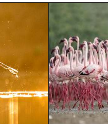
આ ઉપરાંત, અહીં લુપ્તપ્રાય ડાલમેશિયન પેલિકન, ઓરિએન્ટલ ડાઈટ, બ્લેક-નેકડ સ્ટોક અને અનેક શિકારી પક્ષીઓ જોવા મળે છે. માત્ર ૨૦૦૮ માં તેને ગુજરાતનું પ્રથમ 'કન્ઝર્વેશન રિઝર્વ' જાહેર કરવામાં આવ્યું હતું.