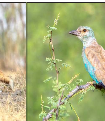
કચ્છી ભાષામાં 'છારી' એટલે ક્ષારવાળી અને 'ઢંઢ' એટલે છીછરું સરોવર. અંદાજે ૨૨૭ ચોરસ કિલોમીટર (૨૨,૭૦૦ હેક્ટર) વિસ્તારમાં ફેલાયેલું આ વેટલેન્ડ રણ અને ઘાસના મેદાનની વચ્ચે એક અદભૂત નિવસનતંત્ર ધરાવે છે. વર્ષ ૨૦૦૮ માં તેને ગુજરાતનું પ્રથમ 'કન્ઝર્વેશન રિઝર્વ' જાહેર કરવામાં આવ્યું હતું.